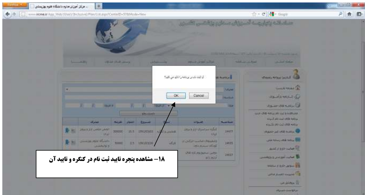
۱۸- مشاهده پنجره تایید ثبت نام در کنگره و تایید آن