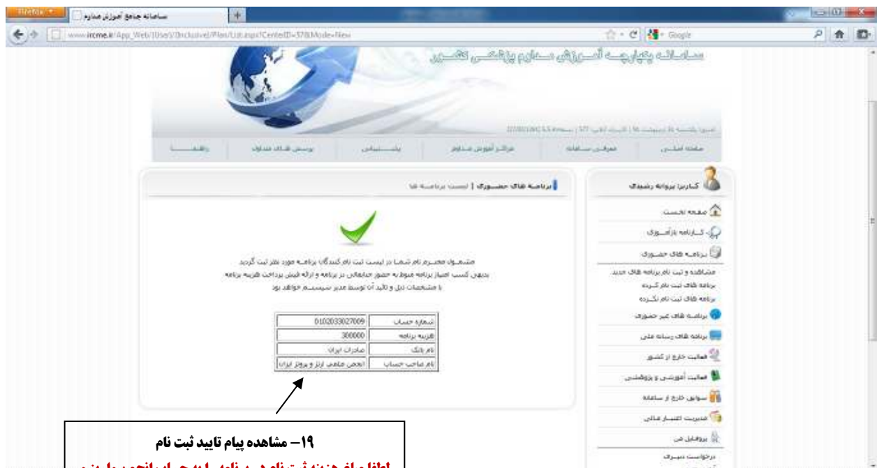
۱۹- مشاهده پیام تایید ثبت نام لطفا مبلغ هزینه ثبت نام در برنامه را به حساب انجمن واريز و اصل فیش پرداختی را روز کنگره به بخش ثبت نام ارائه فرمائید. همچنین امکان پرداخت آنلاین با مبلغ فوق در سایت کنگره و انجمن به نشانی های www.isaop.ir www.cong10.isaop.ir